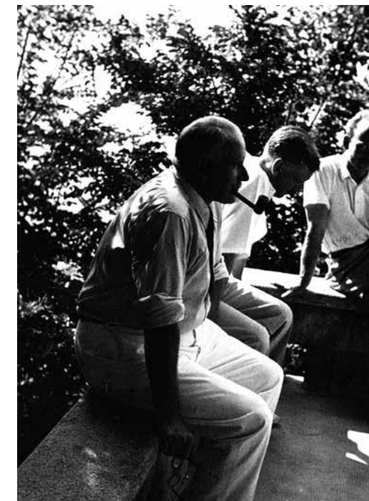
❖, Carl Gustav Jung, Ascona-Moscia, 1933

Naturalmente la figura centrale degli incontri, alla quale dedica più ritratti è quella di Carl Gustav Jung (1875-1961), con il quale intrattiene anche un intenso rapporto epistolare, inviandogli le foto degli incontri e tra le quali cui la famosa serie della mantide religiosa. In tutta risposta il psicoanalista zurighe-