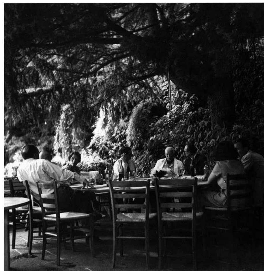
Tavola rotonda di Eranos con, tra gli altri, Gershom Scholem, Carl Gustav Jung e Mircea Eliade, Ascona-Moscia, 1950