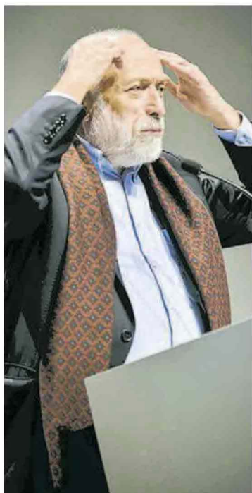
“Carlin”. “Un provinciale come me”